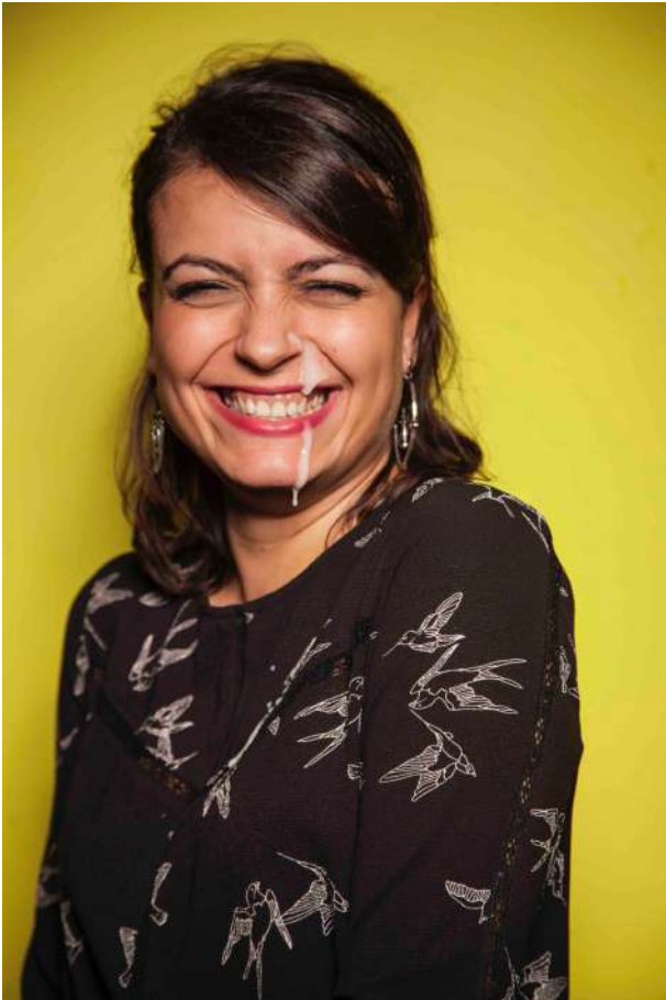
> Youpi Youporn - Théâtre ONYX - Nantes (44) Studio photo inattendu en avance 67 ans sur les moeurs de nos contemporains