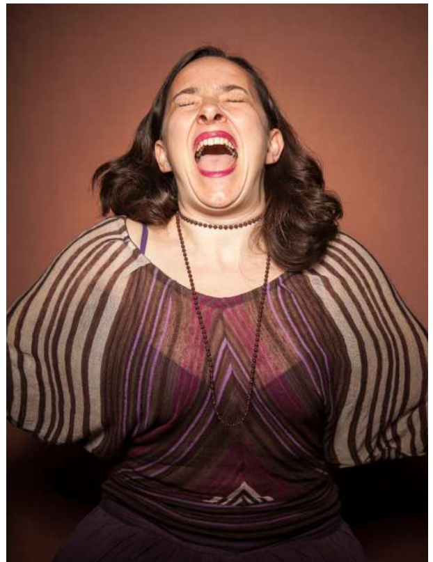
> Old Smokey - Murs à pêches - Montreuil (93) Expérience sur les expressions faciales