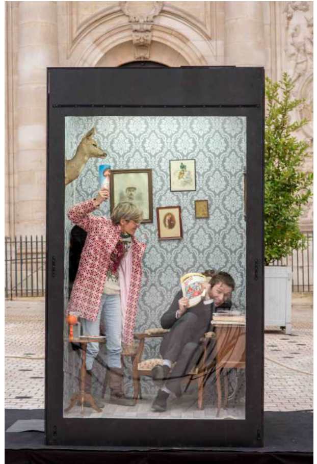
> Sold Out - Place commerçante - Nancy (54) Surprendre les passants avec l'inventivité des modèles