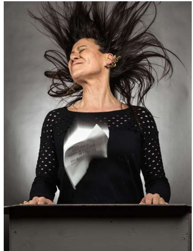
> Municipales - L'autre canal - Nancy (54) Allier plaisir des yeux et celui des oreilles