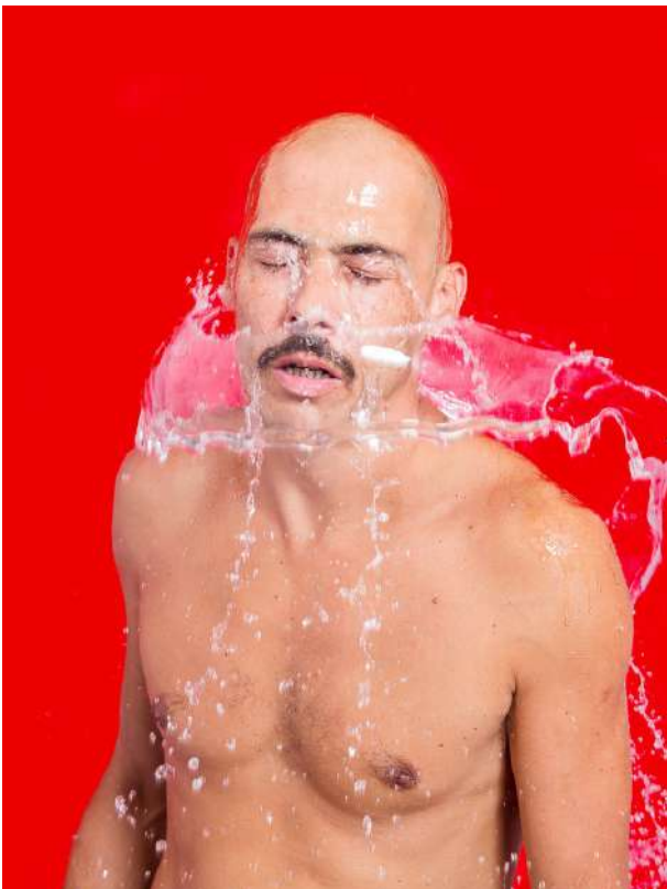
> Guillaume tell - Tapis chouech - Marseille (13) Accueillir la surprise