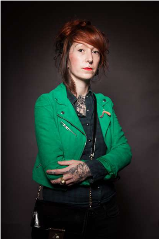
> Vie de Château - La Douëra - Malzeville (54) Traduire en oeuvre la visite d'une exposition